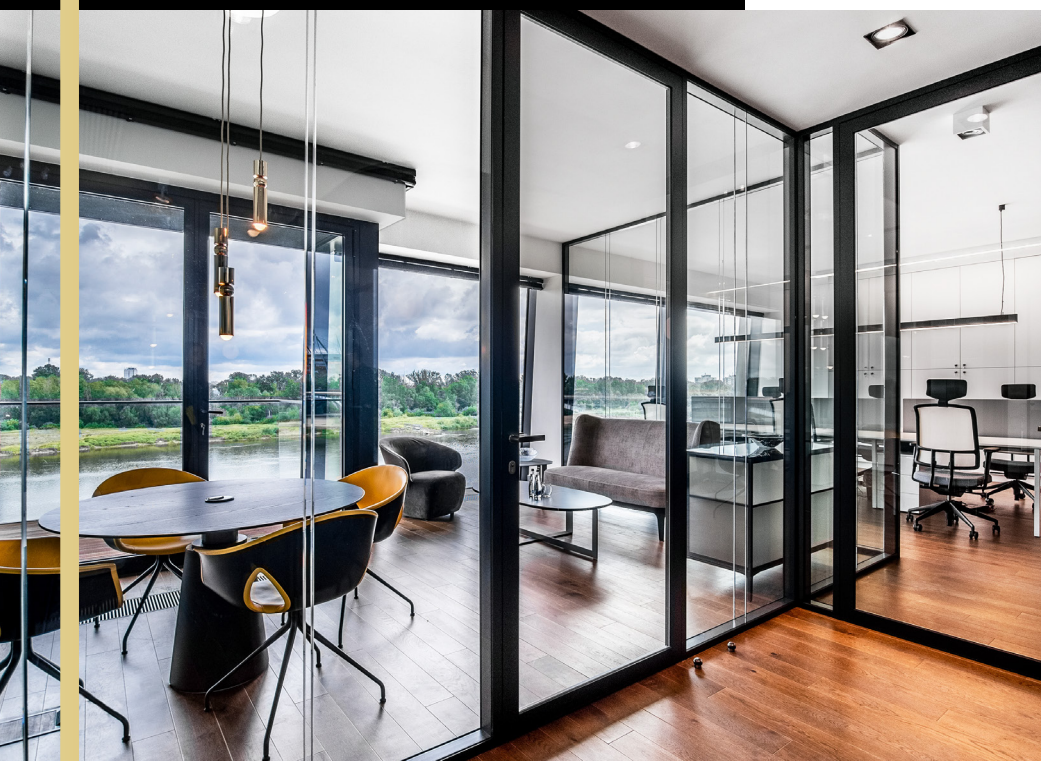
Dwuszybowy system bezszprosowy