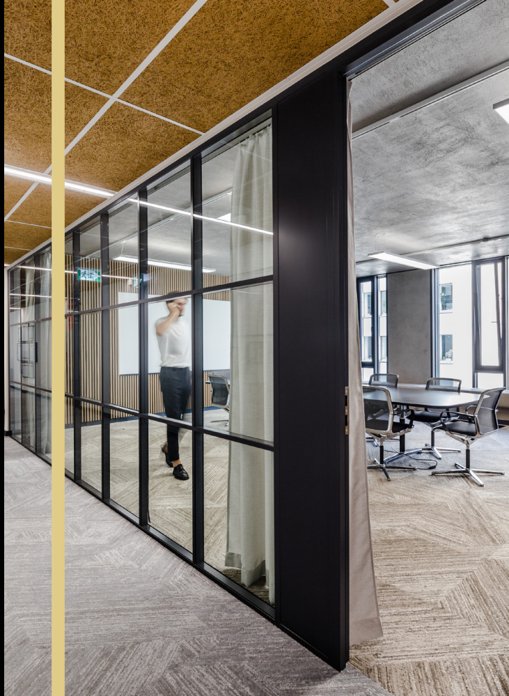
Dwuszybowy system loftowy

Ilość rozwiązań w systemach dwuszybowych stawia Vetro Systems na pozycji lidera na polskim rynku. Eleganckie i zaawansowane akustycznie, loftowe, bezszprosowe czy z inteligentną folią – każdy znajdzie tu coś dla swojej przestrzeni. Systemy dwuszybowe idealnie sprawdzają się w kancelariach prawnych, pomieszczeniach dyrektorskich czy reprezentacyjnych salach spotkań.