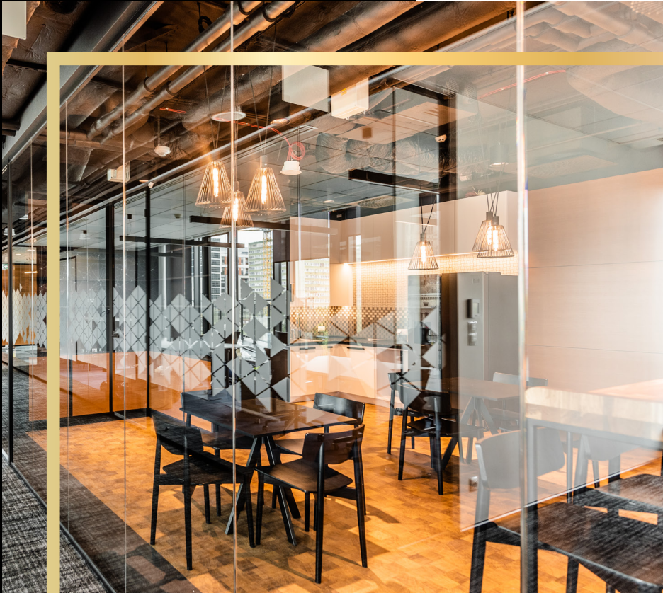
System jednoszybowy bezszprosowy