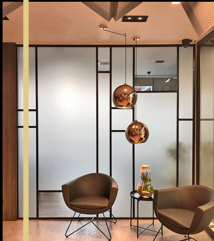
System jednoszybowy loftowy z folią

W ofercie Vetro Systems dostępnych jest aż 6 takich systemów. Są to m.in.: ściany bezszprosowe w cienkiej, 30-milimetrowej ramie, ściany przeciwpożarowe czy podnoszące komfort pracy – ściany z rozwiązaniem IzoSound – idealnie nadające się do przestrzeni mieszkalnych, lokali gastronomicznych czy powierzchni biurowych.